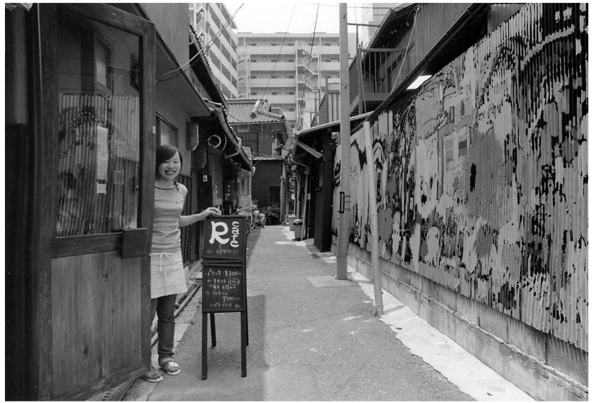
「何を残し、何を創っていかねばならないのか」。学生たちの問いかけから生まれた「R cafe」

ここで問題意識をもった一つは、住宅ストック問題です。いま、日本は年間二二〇万件の住宅が新築されています。しかし住宅が足りないのかというと、確実にあまっています。そして、そのほとんどが建て替えます。二二〇万件の建物を建てる代わりに二二〇万件の家が壊されています。いろんな理由で取り壊されるので、いろいろの理由は業者にとって取り壊し、新築するほうが儲かるからです。しかし、古い家もっている何か懐かしい感じは新築で