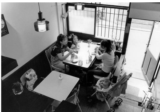
自宅のダイニングでくつろぐかのようなカフェ「パラボラ」