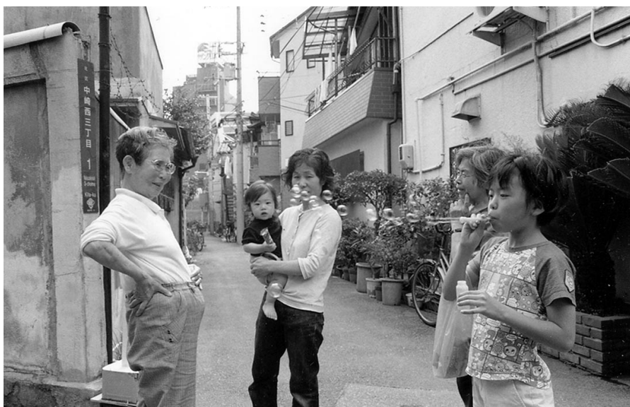
お年寄りと子どもたちが言葉を交わす路地の風景がある

新・旧住人がいっしょにアートフェアを運営する関係も芽生えてきた。フェアをきっかけに、地元の人たちがお店やギャラリーを覗き、新しい触れ合いも生まれている。自然にお店同士の行き来も広がってきた。ニューカマーたちが個々に描いている夢は、このまちをどう変えていくのか。「何を残し何を創ってい