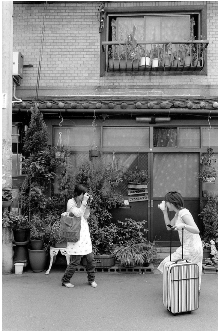
レトロなまちにタイムスリップしてくる若者たちが続々