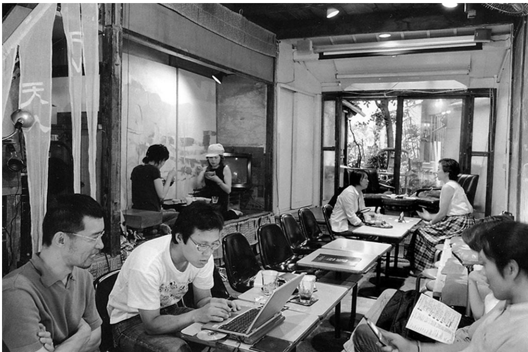
さまざまな出会いとアクティビティが生まれるカフェ「Salon de AmanTo(天人)」

プトに、改修過程そのものをパフォーマンスとして公開。ご近所の人やクチコミで興味を持ってやってきた人たちなど、延べ一・二九人が関わる長屋再生を成し遂げたものだ。「公園のような場所をつくりたかった」と