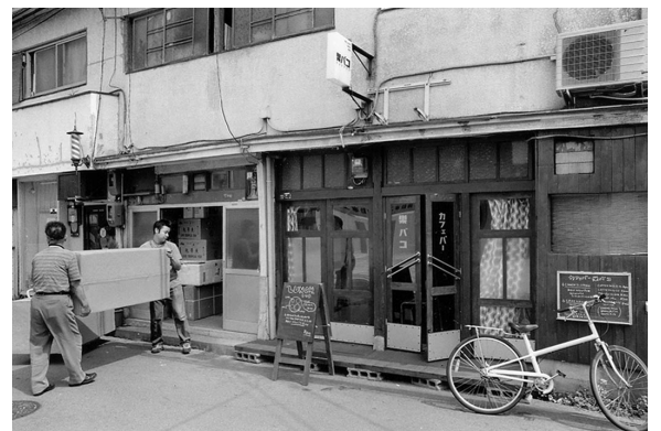
カフェ「楽バコ」は、等身大の懐かしさがつまった手作りの空間

た「cabo verde」。大阪発信のカジュアルなブランドアイテムやシャツやパンツのカスタムメイドを手がける、こだわりの店だ。同じ建物内に「gab gallery」を併設し、アクセサリや小物など若手作家の作品を発表する場としても活用されている。幹線道路・都島通からほんの少し入ったあたり、一棟の長屋にユニークな三つの世界がポップと並ぶ。向かって右側に、ギャラリー&カフェ&バーの「楽バコ」。若い女性二人が、長く空き家だった一戸を借りて、コソコソと自力で改装し、小学校の机と椅子などなど、懐かしい家具を集めてつくった、文字通り巣箱のような空間だ。