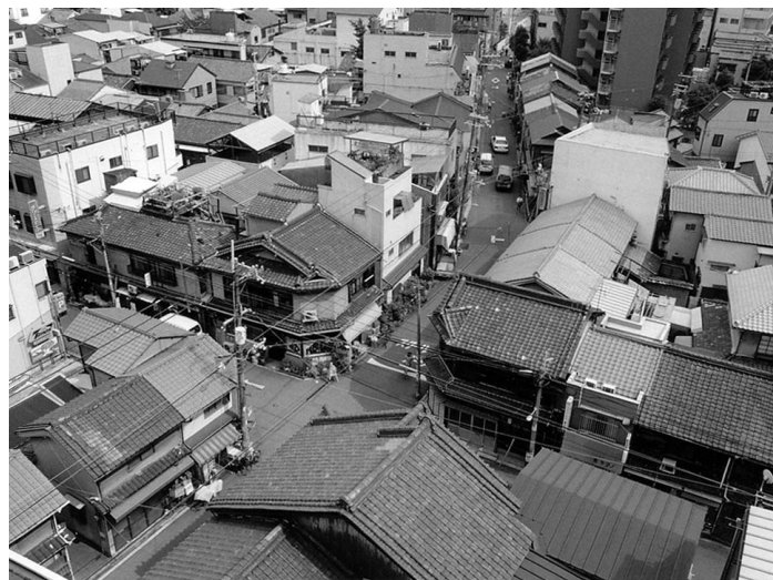
戦前からの路地と長屋の懐かしい風景が残るまちかど

戦災によって、こうした長屋の多くが姿を消していった。しかし、かろうじて戦災を免れた地域に、今もなお多くの長屋が命をつないでいる。一見、戦後の都市開発から取り残されたかのように見えていた長屋街が、実は成熟社会における持続可能な都市の発展を支える仕組みや都市居住のモラルなど、学ぶべ