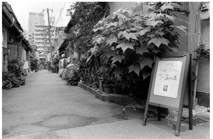
緑溢れる路地の中にアートギャラリー「楽の虫」がある。彼方には梅田の超高層ビルが

にする格好の空間なのである。それぞれの夢を求めて中崎町にたどり着いた新たな住人たちは、戦前からの暮らしが凝縮された長屋のまちを舞台に、何を思い、どんな営みを繰り広げているのか。ニューカマーの動きを通して長屋の意味を考えてみたい。