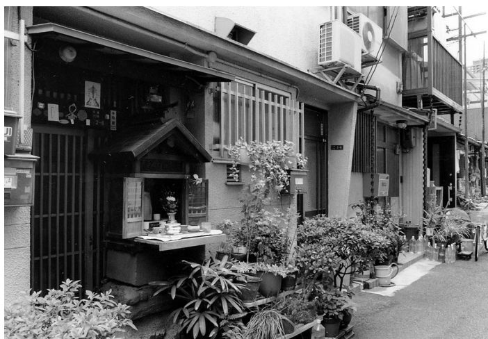
お地藏さんとともにゆっくりと時が流れる路地

JR東海道線の東側に足を踏み入れると、一転時代が変わったかのようにスローな空気漂うエリアが現れるのである。時のスピードを隔てる鉄道の高架は、まるで残されたまちを守る城壁のようにさえ見え、高架下のトンネルは、不思議の国への入り口とでもいうべき印象を宿す。暗闇を潜り抜けて道を進めば、やがて長屋が軒を連ねる町並みにたどり着く。振り返ると高架の向こう側に、ターミナルを取り巻く高層・超高層のビルのシルエツトが重なっている。時代の断層を見るかのような眺望が目飛び込んでくる。