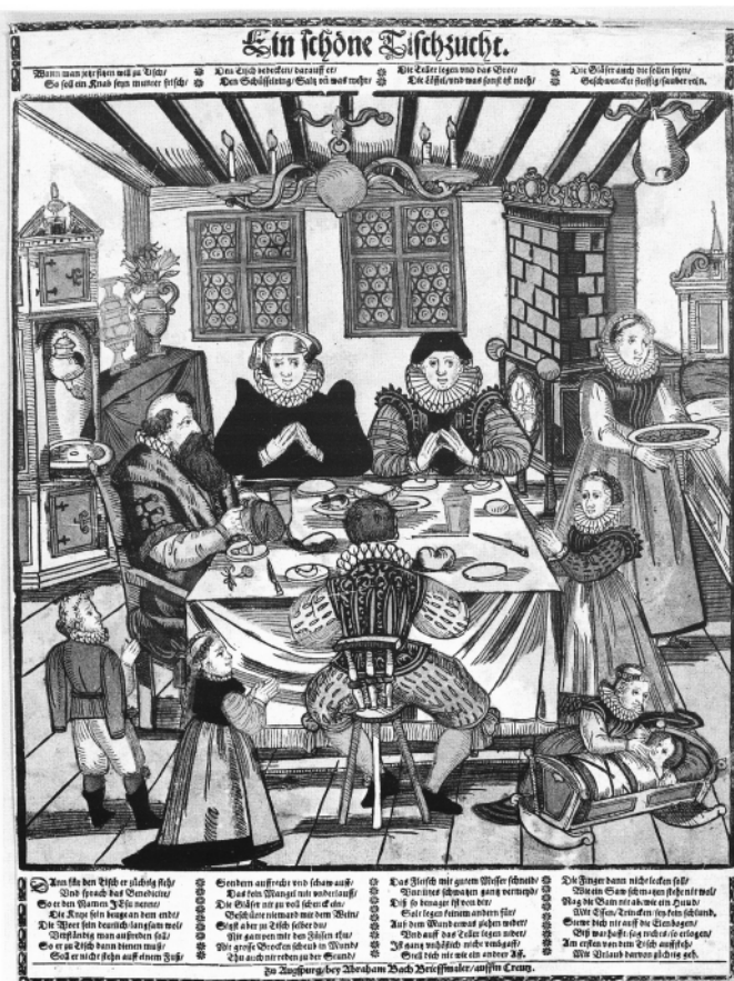
17世紀ドイツの食事作法のための絵入りリーフレット

国家の政策として重要なのは、ひとつは広範な福祉政策であり、もうひとつは、近代的な食