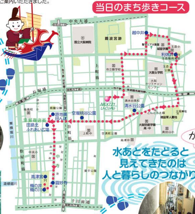
当日のまち歩きコース

高津公園には現在でも谷地形が明瞭。かつて「梅の川」が流れていたというところには「梅の橋」が今も残されています。