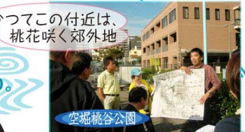
かつてこの付近は、桃花咲く郊外地