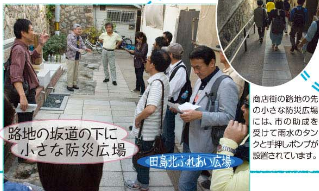
路地の坂道の下に小さな防災広場

台地西縁の崖地には昔は湧き水も多かったそう。「水の寺」と称された圓妙寺には、今も現役の井戸が2つあります。