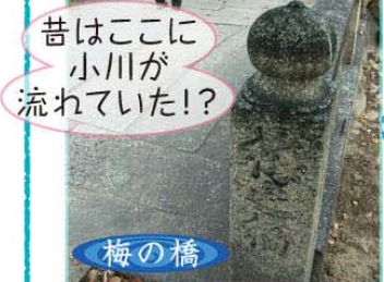
昔はここに小川が流れていた!?