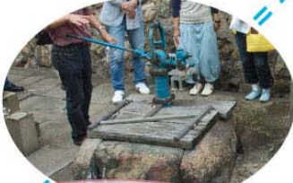
2つのポンプから豊かな水が!

玉造稲荷神社境内に、数年前に再生された井戸を訪問。秀吉の時代、この近くには千利休の屋敷があったそうです。