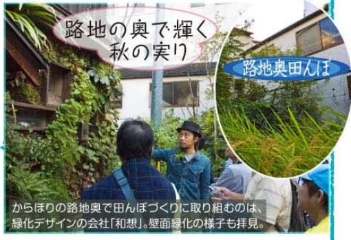
路地の奥で輝く秋の実り