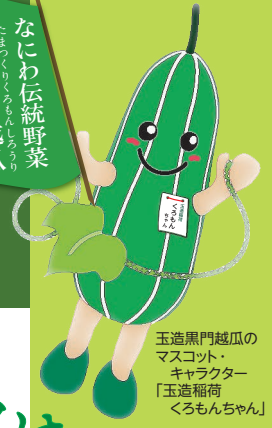
玉造黒門越瓜のマスクット・キャラクター「玉造稲荷くろもんちゃん」