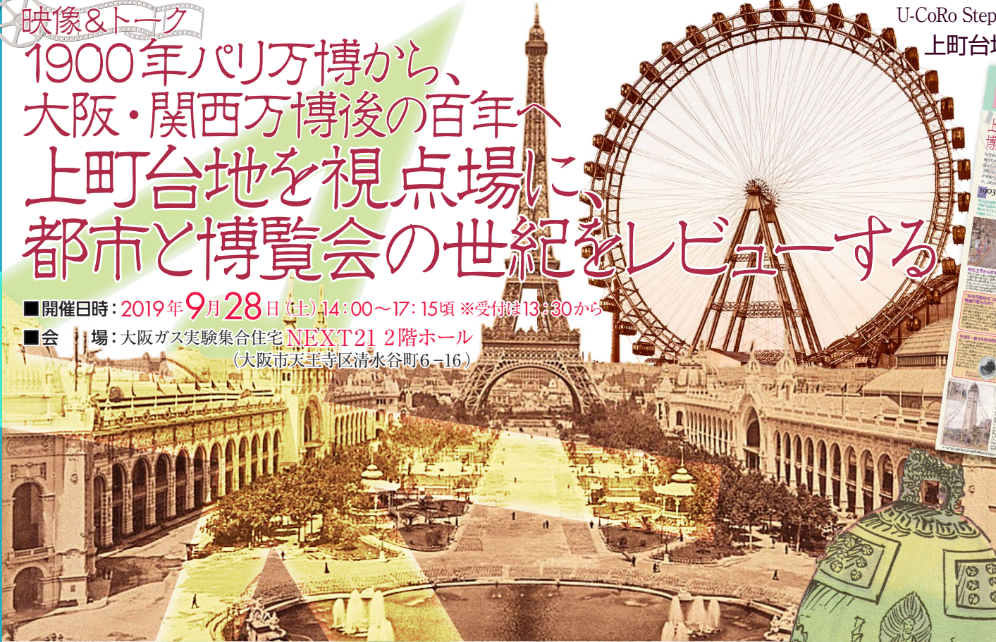
1900年第五回パリ万博「Cafes du Guatemala」、大観覧車のカラージュ

*「上町台地 今昔タイムズ」のバックナ ンバーや、プロジェクトの歩みは、ホ ムページ「大阪ガスCEL」「U-CoRo」 で検索してご覧いただけます。