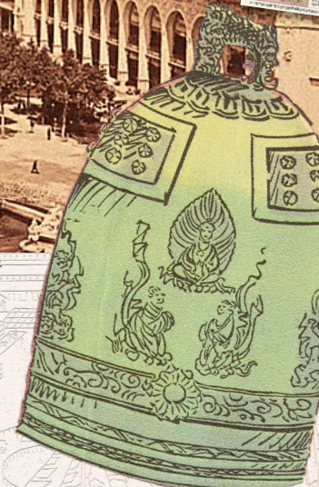
今はなき「四天王寺大釣鐘」は、「聖徳太子千三百年御聖忌」に向け鑄造された世界最大級の釣鐘。1903年の第五回内国博で初披露された(「第五回内国勧業博覧会全景明細図」の部分)