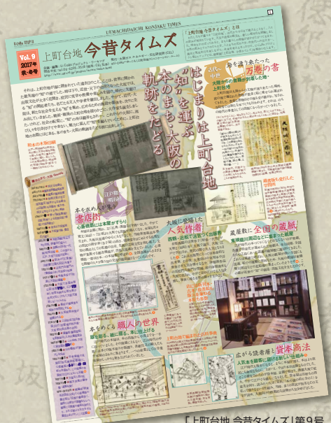
「上町台地 今昔タイムズ」第9号

過去と現在を行き来しながら未来を考える「上町台地・今昔タイムズ*」第9号のテーマは「はじまりは上町台地“知”を運ぶ本のまち・大阪の軌跡をたどる」。古代世界に開かれた最先端の“知”の港に始まり、近世・近代には時代に先駆けた“知”の開拓者や媒体を生み出したまち・大阪を振り返り、その原点・上町台地からこれからのありようを問うています。