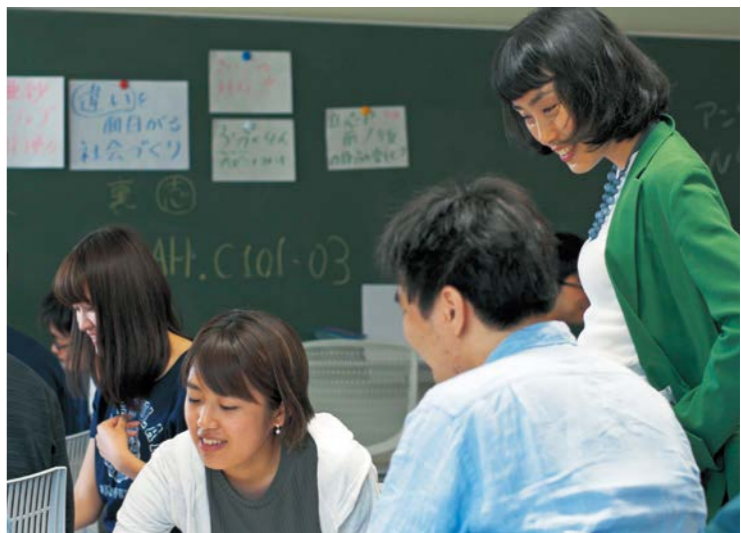
ディスカッション力とともに、プレゼンテーションの技術を磨くのも、授業の目的のひとつ。

東工大でリベラルアーツ教育をやっているという、科学技術とは関係ないものにも力を入れているのだなど多くの人に思われてしまう。けれども、リベラルアーツとは決して文系科目のことでは