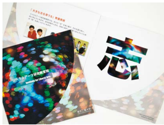
リベラルアーツ研究教育院のパンフレット。スローガンでもある「志」の文字が大きくあしらわれる。

1958年、東京都生まれ。東京工業大学教授。専門は文化人類学。「癒し」の観点を早くから提示し、生きる意味を失った現代社会への提言を続けるとともに、日本仏教の再生に向けた運動にも取り組む。東京工業大学では、講義にディスカッションやワークショップを取り入れるなどの試みにより、学生の授業評価が教員中第1位、2004年の「東工大教育賞・最優秀賞」を授与される。2016年に新設されたリベラルアーツ研究教育院の院長をつとめる。著書に『生きる意味』（岩波新書）、『ダライ・ラマとの対話』（講談社文庫）、『人間らしさ』（角川新書）ほか多数。