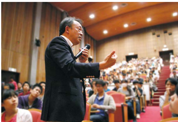
「東工大立志プロジェクト」での、大人数講義。池上彰氏をはじめ、錚々（そうそう）たる講師陣が顔をそろえる。