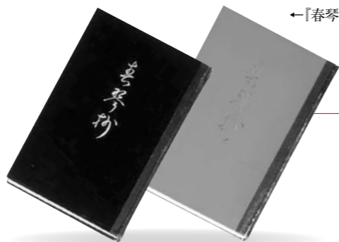
←「春琴抄」漆塗初版本

大阪の出版社創元社刊。本文は変体がなによる。黒と赤2種の豪華な漆塗り装丁が大いに話題を呼んだという。