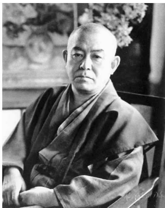
↑自宅応接室での谷崎潤一郎

選び、「谷崎潤一郎——愛と創作のジャンクション」と題した新作を上演した。本稿では、その制作プロセスのかでの視点や、谷崎潤一郎(以下、谷崎)ならではの逸話を抜粋して綴ってみる。