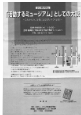
シンポジウム「活動するミュージアムとしての大阪」の案内状

るまちづくり」という視点から、実際に場づくりや賑わいづくりに携わっている方々などをゲストに招き、現場の事例を研究し、エコミュージアムの概念から大阪を見てみようという試みであった。時間不足で十分な議論にまでは到らなかったものの、総じて好評をいただいた。大阪で新たな試みを