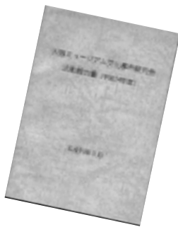
大阪ミュージアム文化都市研究会活動報告書 (平成14年度)