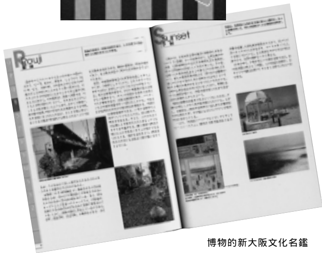
博物的新大阪文化名鑑