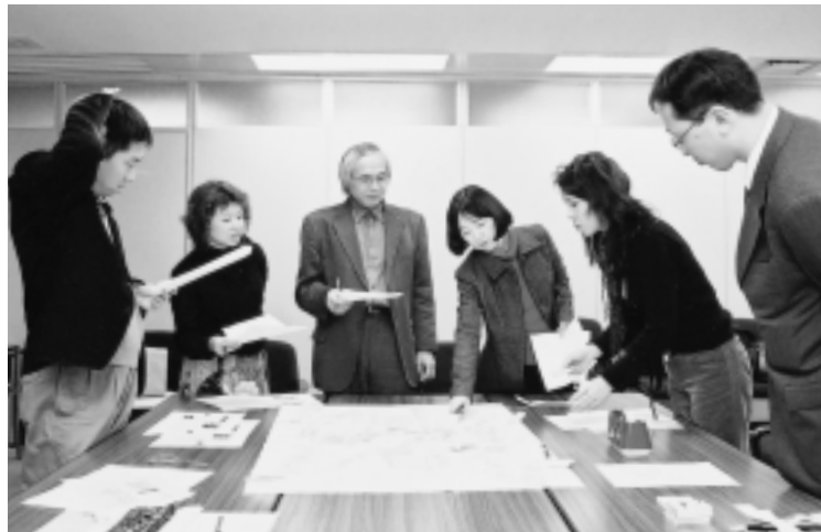
チャート図を作成中の研究会メンバー

一つ一つの文化的項目自体、複数の柱(A、B、C)にまたがる内容を持つものも多く、相関図としてA、B、Cのキーワードの位置を定めるのは難しい作業であった。当研究会メンバーの中で飛び交った様々な意見を一旦定着させたが、完成形とは言えない(完成形はないかもしれない)。大阪文化の今を捉える本書の編集作業の、プロセス・一試案としてご理解いただき、大阪のまちや文化に関して語り合うきっかけにしたいだけあればありがたい。これまで蓄積された様々なストックのリノベーションやそこから始まる多くの