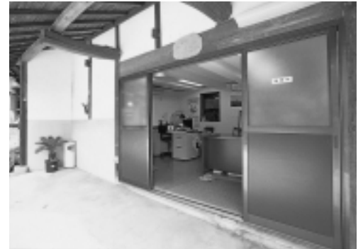
納屋を改造して事務所として使用。母屋の雰囲気を崩さずに業務ができるようにしているのも、配慮のひとつ

『離れ』を改修した部屋。床暖房を入れるなどしているが、基本的には、もとの部屋の意匠そのままに使用していることで、利用者にも好評とか