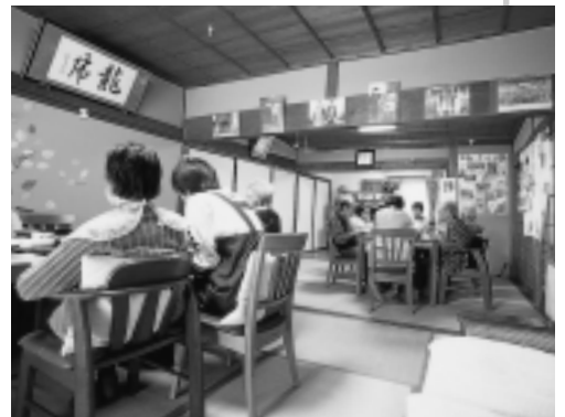
居間を中心に3つの部屋を1つにした、デイサービスルーム。絵や写真なども部屋の雰囲気に合わせたものが飾られている

『離れ』を改修した部屋。床暖房を入れるなどしているが、基本的には、もとの部屋の意匠そのままに使用していることで、利用者にも好評とか