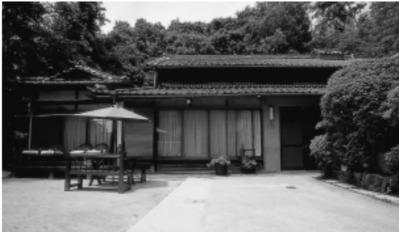
「中町倶楽部」外観。築60年を超える住宅の雰囲気を残しながら改修し、デイサービス用の施設としている