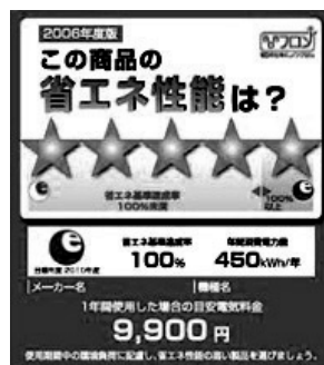
図2 統一省エネラベル

費者にはわかりやすいものとなっております。また以前より「トップランナー」の考え方で、家電の省エネ性の底上げにつながる省エネラベル制度も行われています。これだけ二酸化炭素削減が叫ばれるようになった今、この省エネラベル制度がもっと消費者に理解され、二酸化炭素削減を意識した商品選択に活かされるためには、さらに二酸化炭素排出量をダイレクトに表示するなど、まだまだ工夫するべきことがあると思っています。