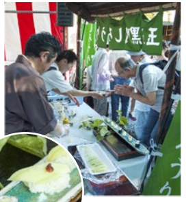
玉造稲荷神社の食味祭では越瓜料理のふるまいが恒例。

上町台地がふるさとの玉造黒門越瓜(たまつくりくろもんしろうり)江戸時代、この瓜は大坂城の玉造門付近で作られていました。古代中国の越(えつ)の国から伝わったことから「越瓜」と書き、読みは「しろうり」;また黒塗りだった玉造門になみ「くろもん」とも呼ばれたそうです。かつては、この瓜の奈良漬は当地の名物として有名でした。