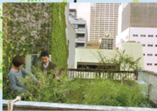
大きなビルに囲まれた、小さなビル上の畑を、風は通る

超高層ビルが建ち並ぶOBPも意外に緑が多い。街路樹、公開空地の植栽、途中階の屋上に設けられた緑のスペースなど、多彩な人工の緑が見られる。街開きから四半世紀が経ち、木々の生長も著しい。