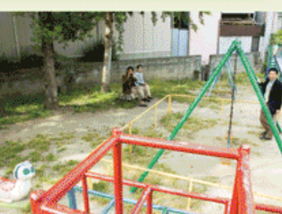
東成区役所周近の小公園

暗越奈良街道が通る地域は、中小の事業所周辺に設けられた緑が目玉に留まる。公園の木々も大木が多く、それぞれ小さいながらも緑濃い印象を与えている。