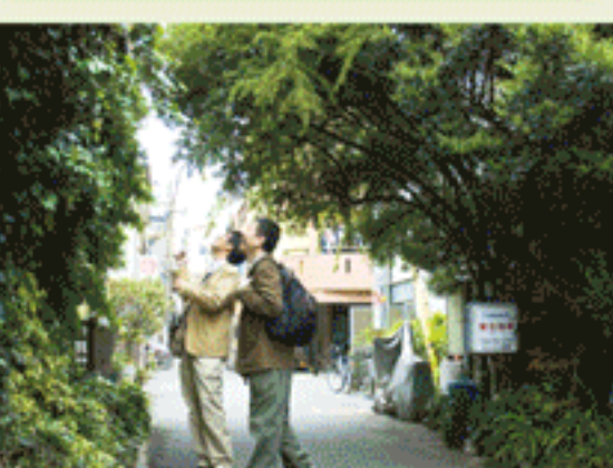
寺田町駅近くの路地

上町台地の良好な住宅地の一つである五条界隈。そのイメージを担うお屋敷群には庭木も多いほか、草花で軒回りをきれいに飾った家も見られる。また、学校や病院など大規模施設の植栽も彩りを添えている。