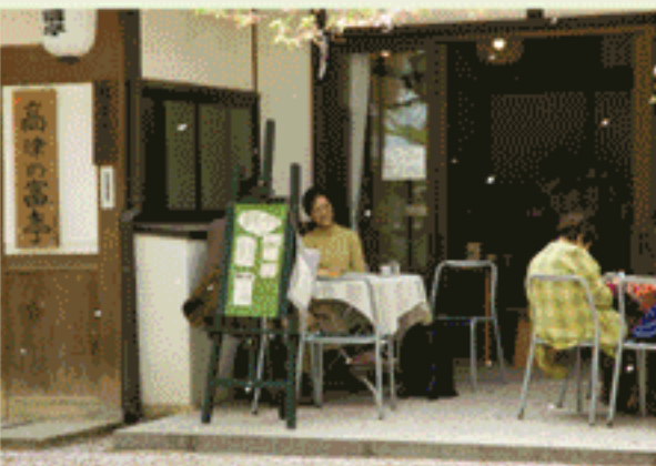
高津宮・高津の富亨カフェ

松屋町筋に近いほど緑が少なくなるが、南北に並ぶ中寺の寺町と高津宮は、緑の島を形作っている。お寺の境内には本堂より背丈の高いイチヨウや桜などもあり、高層ビルが少ない通りでは遠くから見える。