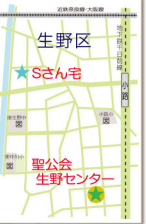
★ 大阪市立大池中学校

参加団体・施設など: 地図上★マーク 味原幼稚園、町家再生複合施設・燈、園妙寺、大池中学校、大阪府教育センター、我趣、鯉節丸と、空堀ことば塾、カンタオプティカル、cocoroom、高津宮、高津高校、高齢者外出介助の会、真田山幼稚園、真田山陸軍墓地、清水谷高校、生活ケアの「ぶらっと」、聖公会生野センター、玉造小学校、玉造幼稚園、デイサービスセンター陽だまり、谷町空庭/空畑クラブ、橋本電器商会、丸善ボタンビル、山本能楽堂、南大江小学校、弥助、レストランRiRe、Fさん宅、Iさん宅、Oさん宅、Nさん宅、Sさん宅、Sさん宅、Sさん宅、Mさん宅、Nさん宅、Yさん宅、Yさん宅、Yさん宅、和想デザイン(順不同、2012年8月1日現在) 共催団体(種苗提供): 玉造稲荷神社、玉造黒門越瓜出隊