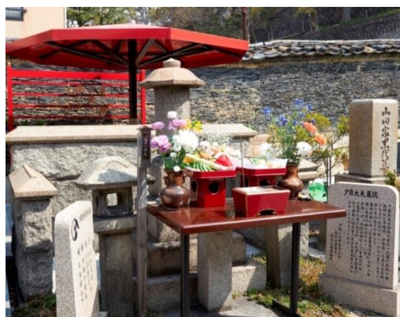
夕霧太夫墓（浄國寺）

二十数年前、下寺町界限に人形芝居フェスティバルが立ち上がった頃から、住職が代替わりした寺がほとんどである。「今の住職は、副住職の頃からこの動きを見ている。10年20年、続けていると、お客さまを迎え入れることに慣れてきた、といいますか、いつも