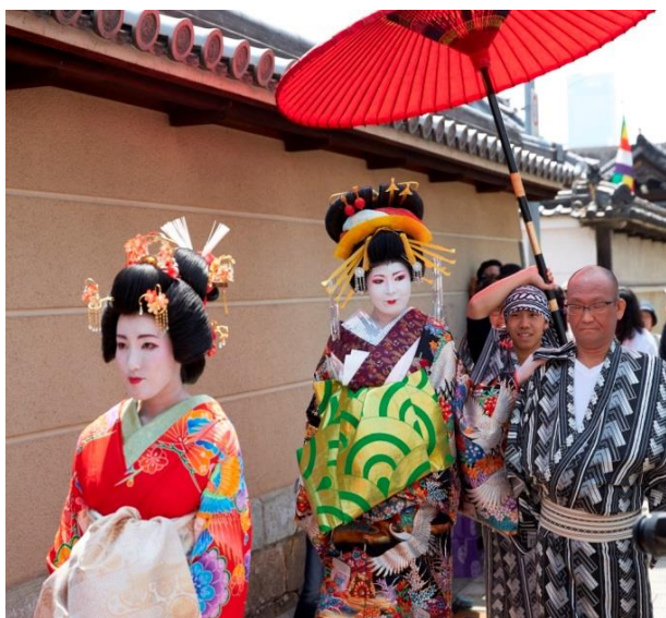
夕霧太夫行列の賑わい

ところでこの日、一心寺界限と少し離れた下寺町の2つの寺院でも、“下寺町活性化プロジェクト「花祭り」夕霧太夫行列”と銘打った催しがあった。江戸時代、大坂で廓があった新町の遊女の中で最も美しかったといわれ、近松門左衛門や井原西鶴の作品の題材にもなったのが“夕霧太夫”である。その墓が、下寺町の浄國寺にあることから、大阪の歴史文化でまちを活性化させたいと、この催しが3年前に始まった。夕霧太夫、新造（若い見習いの遊女）禿（童女）を含む、大勢の行列が、金臺寺（こんたいじ）から浄國寺まで、太夫行列を行った後、法要を行うというもので、両寺では人形劇やお茶席など、見物するすべての人が楽しめるプログラムを提供していた。これは、近年毎年開催されており、2年に1回の下寺町全体での人形芝居フェスティバルの時は、その中の催しの1つに含まれる。