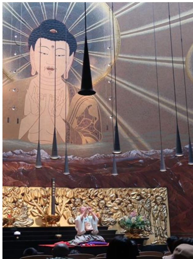
左：一心寺三千佛堂でのパペット落語